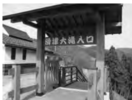
滝まで174段下ります