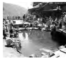
釣り堀でボートするのも◎