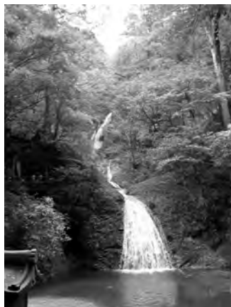
滝つぼの正面から