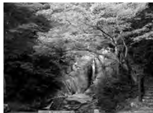
次郎広場の紅葉もおすすめ