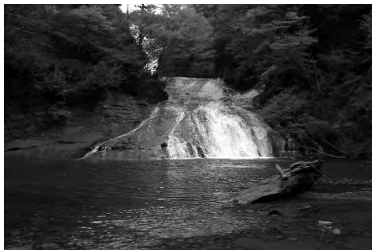
滝つぼから下流に滝をめぐる遊歩道があります