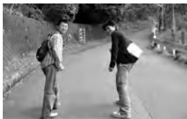
車を停めてここから歩き。出発!