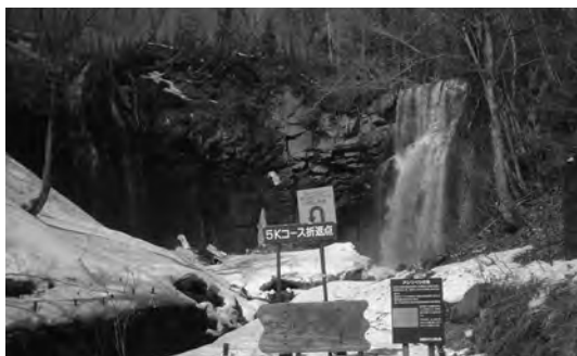
アシリベツの滝全景