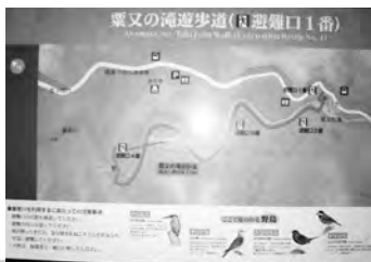
周辺の案内板 自然と温泉に浸りませんか?