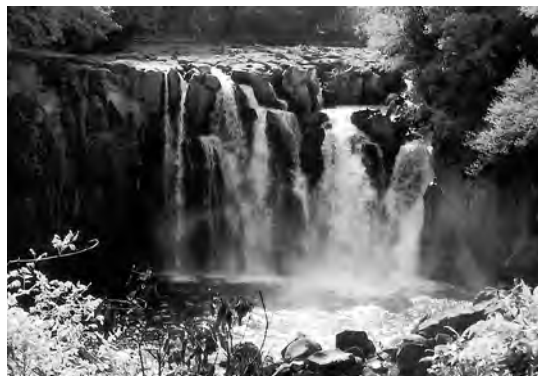
四季折々変わりゆく滝の表情