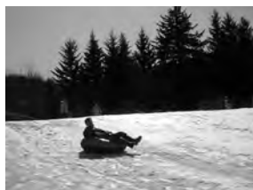
冬はチューブすべり