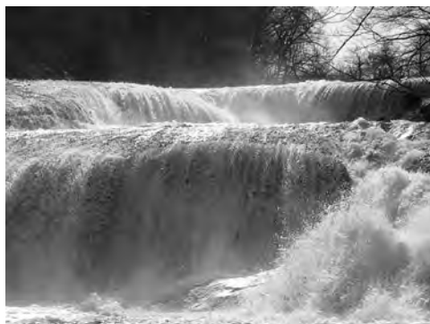
大迫力の滑津大滝