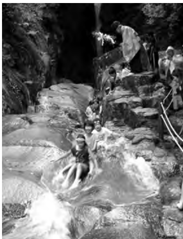
滑り初めの儀式もあります