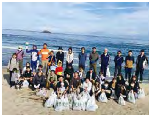
鳥取砂丘一斉清掃に参加した「梨香会」の皆さんとそのご家族

鳥取砂丘一斉清掃は、砂丘の美しい自然を守るために、1980年から春と秋の年2回行われています。今秋から、ハロウィンの仮装で楽しみながらの清掃を推奨しており、仮装して参加したメンバーもちらほら。当日は3事業所の社員とその家族、合わせて67名が、残暑の続く秋晴れのもと、海岸の一斉清掃に汗を流しました。