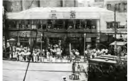
⑪ 銀座に誕生した三愛。大理石が随所に使われるなど、戦後もまもなく建造されたものとしては立派なものだった。（1946.8）