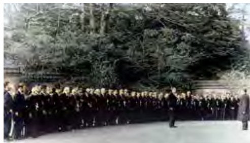
20 褒章受章者を代表して天皇陛下にお礼の言葉を述べる (1961.12)