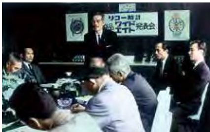
23 電池式腕時計「リコーワイドエイト」の発表会見 (1966)