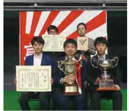
優勝した「リコー（1）」チームの皆さん

今回の優勝を受けて、3月に開催予定の日本選手権（社会人日本一と学生日本一による優勝決定戦）に出場することが決まりました。