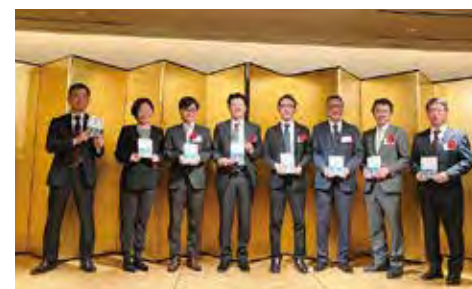
年男・年女の皆さん