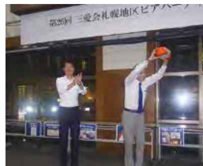
愛の手募金を贈る北海道支部 国松支部長（左）