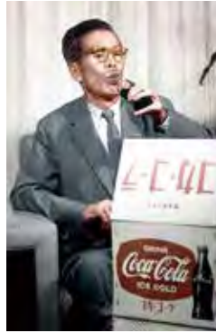
21 空輸便で届いた生産第1号のコカ・コーラを飲む (1963.5.4)