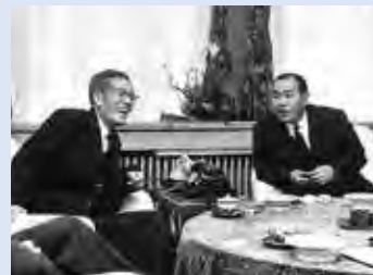
郵政大臣・田中角栄氏と