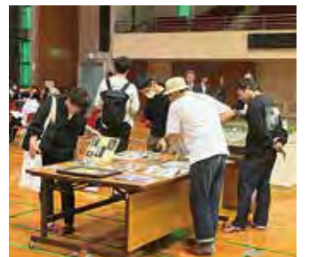
アルバム等資料公開エリア