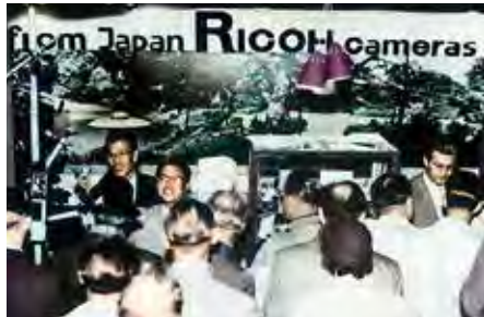
⑫ 第5回フォトキナに初参加（西ドイツ・ケルン 1956.9.28～10.7）