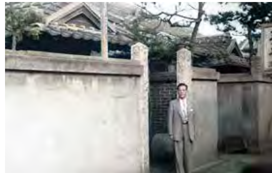
⑦ 吉村商会の創立場所 (福岡市春吉四十川) を訪れる (1955.5)