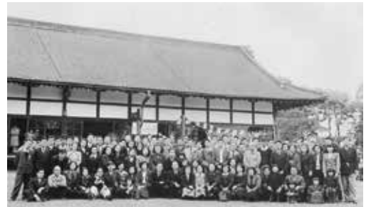
⑫ 明治記念館 年賀会（1948.1）