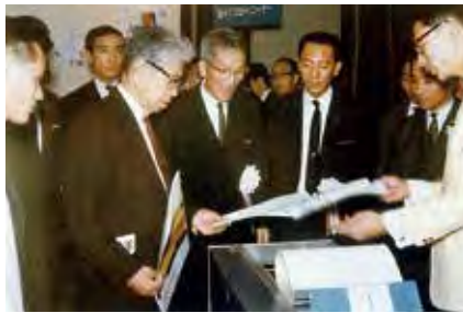
34 『電子リコピー BS-1』発表会。 リコー再建の原動力となる (大阪にて 1965.8)