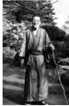
19 静養中 (1961頃)