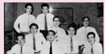
中曽根康弘氏(前列中央)の国務大臣入閣祝賀会。前列右端が市村(1959年頃)