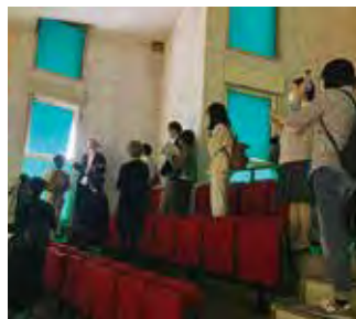
現地見学会の様子