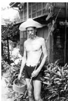
⑥ 生家前にて (1927夏頃)