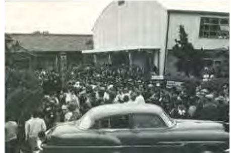
17 小学校への講堂寄贈祝賀祭には村中から大勢の人が押し寄せた (1958.4)

5月、時の通産大臣佐藤栄作氏や中京財界の要請を受け、高野精密工業株式会社の取締役社長に就任、再建に乗り出す。(8月、高野精密工業をリコー時計株式会社に社名変更。86年4月、リコーエレメックス株式会社に社名変更) 23