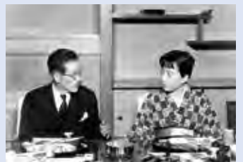
作家・有吉佐和子さんと