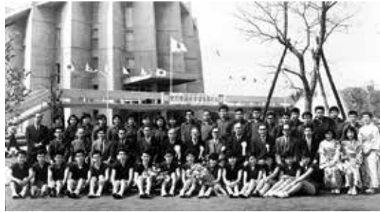
(27) 佐賀県体育館で開催された全国選抜卓球優勝大会に出席(1966.4)