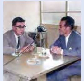
ソニー社長・伊深大氏と