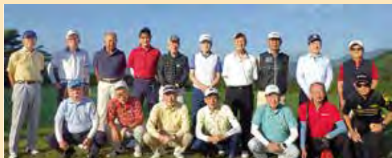
ゴルフサークル リコー三愛ゴルフ・秋大会（2024.10）