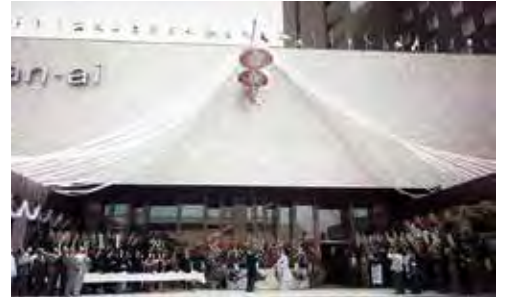
(24) ホテル三愛の完成式典(1964.7) 設計は佐賀県体育館などを手掛け、モダニズム建築の第一人者として定評のあった坂倉準三氏