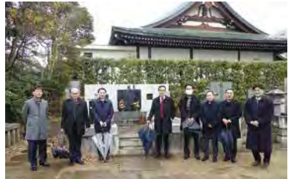
リコージャパン笠井社長（左から4人目）はじめ役員一同