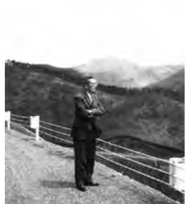
31 阿蘇の山並みを眺める