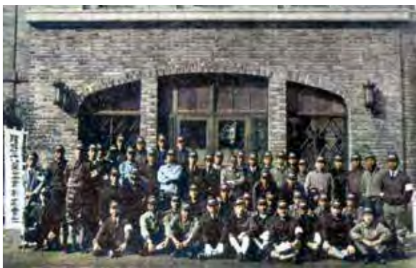
⑩ 1943年頃結成された特設防護団。銀座8丁目の理研光学工業本社前にて