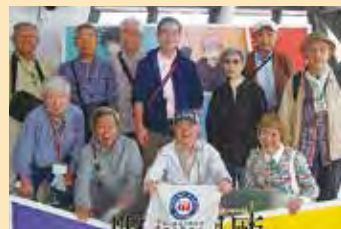
散策サークル 東京スカイツリー（2024.10）