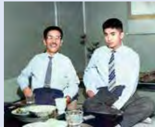
作家・石原慎太郎氏と