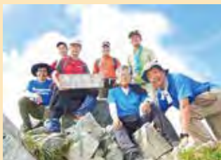
ハイキングサークル 立山（奥大日岳・別山）（2024.8）