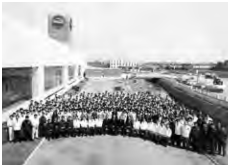
22 新設された日米コカ・コーラボトリングの鳥栖工場落成式での記念撮影 (1968.6.20)