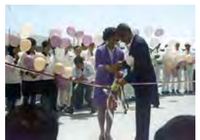
33 東北リコー本社工場落成式でテープカットをする (1968.5.17)