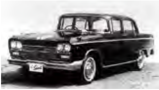
(28) リース物件第1号となった三菱自動車デボネア

9月、東京オリンピック大会を目前にして、欧米事情視察のため、幸恵夫人を伴って50日間にわたる世界一周旅行に出発。(30)