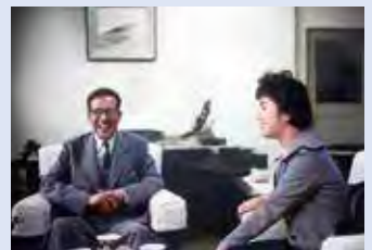
歌手・ペギー葉山さんと