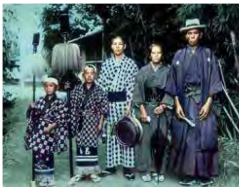
② 両親、弟たちと佐賀北茂安の生家にて (1918頃)。この4年後には、一家の大黒柱として両親への仕送りを始めた