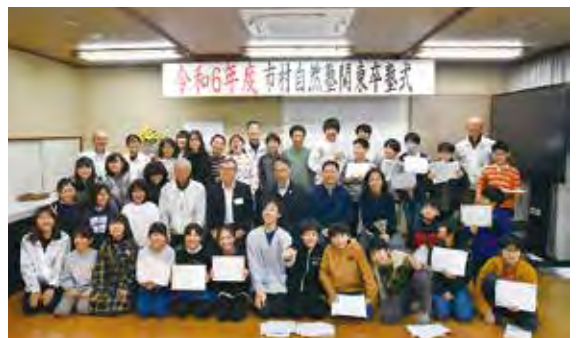
ご来賓やスタッフと一緒に「はい、チーズ！」。みんな、いい笑顔です！