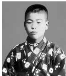
① 小学校では常に首席であった (1910、小学4、5年生頃)