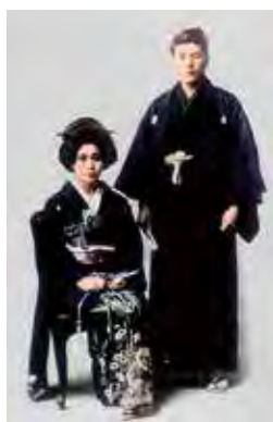
⑤ 結婚式 (1925.1.26)