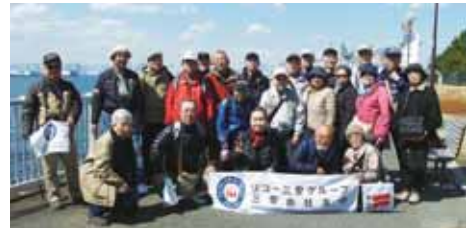
社友会散策サークルの皆さん (2017.3.16 東京ゲートブリッジにて)