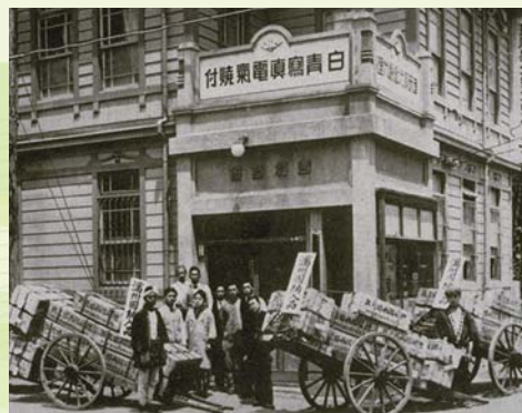
福岡の吉村商会と社員たち（1935） 1929年、理研感光紙の九州総代理店の権利を得て、福岡に初めて店舗を構えた。理研という大企業との長きにわたる縁の、最初の糸の結び目が結ばれた。35年ごろには、満鉄攻略に成功し、感光紙を大量に発送する