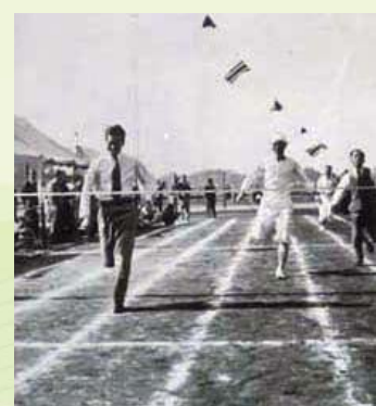
トップでゴール！ 三愛会合同運動会において (1947.6.1)

戦後まもなく、明治神宮の再建に力を貸してほしいと要請を受けた市村は、結婚式場を思いつく。結婚相談から挙式・披露宴まで一切を斡旋するというスタイルが評判となり、大繁盛となった