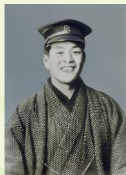
中央大学の学生時代 (1920) 貧しさのあまり、共産主義に傾倒したり、結核を患ったりしたが、翻意して肉体と精神の健康を取り戻す