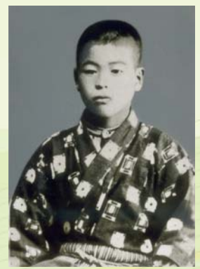
小学校4、5年生 (1910) 貧しい生活だったが、成績抜群、遊びやいたずらでもリーダー格だった