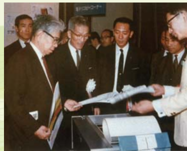
大阪にて電子リコピー BS-1 発表会 (1965.8)

故郷には苦難の思い出が満ちていた。人生の前半はそこから脱却するための戦いであった。しかし、老境に至って思い浮かぶのは懐かしい風景である。故郷のために何かしたいという感慨がわき上がってきた