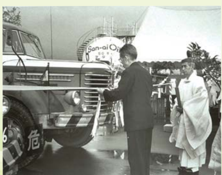
三愛石油羽田営業所開設式 (1952.10.27) 燃料タンク車が飛行機のところまで行って給油している様子を眺めているとき、水道のようにホースを引っ張ってきて給油すれば効率が上がるとひらめいた。この着想がやがてハイドラントシステムによる給油となる

57年、米国カメラショーの帰途に立ち寄ったマイアミ市に、日本の桜を寄贈することを決めた。しかし、桜は病原菌予防のため輸入禁止と判明したため、東洋原産のオーキッド300本を寄贈。さらに、日本庭園（イチムラ・ガーデン）も築き、日米親善に一役買った。